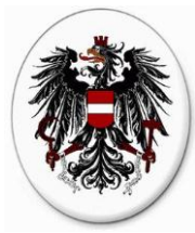
Österreichische Botschaft in Bratislava